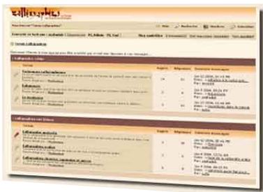
Le forum internet