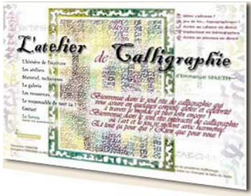
Le site internet